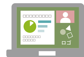
背景+ロゴ（セミナー名等）