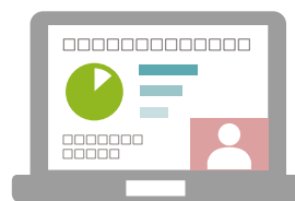
ピクチャーインピクチャー

A2. 2画面やピクチャーインピクチャー、テロップ表示など複数の構成が可能です。 事前にご希望の構成パターンを会場スタッフにご相談下さい。